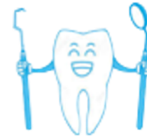
Inicio de tratamientos