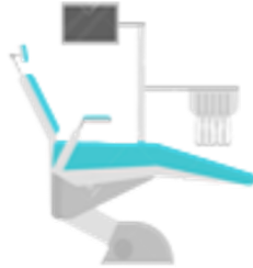
Sentarse en sillón