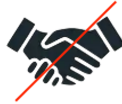
No dar mano